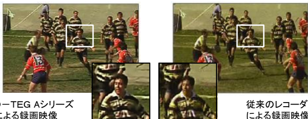
D-TEG Aシリーズによる録画映像